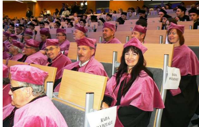
Rada Wydziału Nauk Społecznych