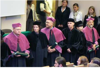
Młodzi doktorzy ze swoimi promotorami