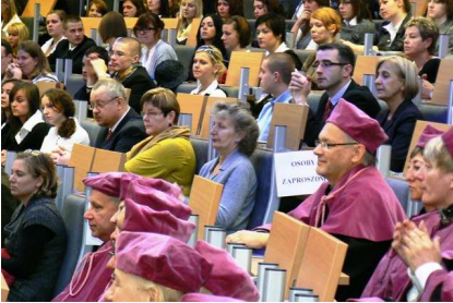
Profesorowie i studenci