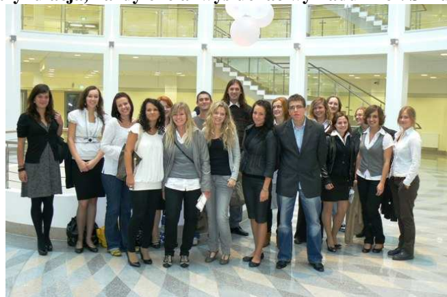
Jesteśmy STUDENTAMI, I rok dziennej Animacji Społecznej