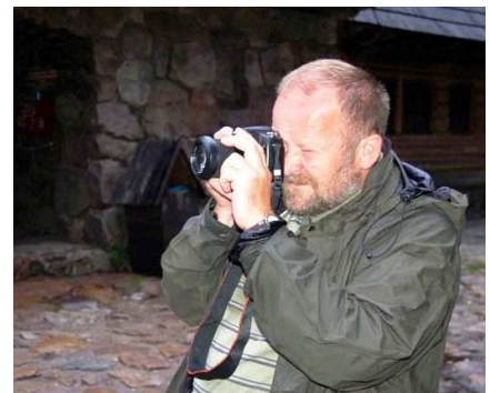
Profesor na polowaniu

Prywatnie Profesor jest miłośnikiem gór, szczególnie Tatr. Wielokrotnie samotnie oraz wspólnie z rodziną przemierzył górskie szlaki. To one, jak harcerstwo szlifują charakter. Kuźnią i szkołą życia stał się również uczelniany chór. Przyjaźni i człowieczeństwa nie da się nauczyć i doświadczać z książek. Hobby laureata to także bezkrwawe polowania... Na jednym został sam 'upolowany'.